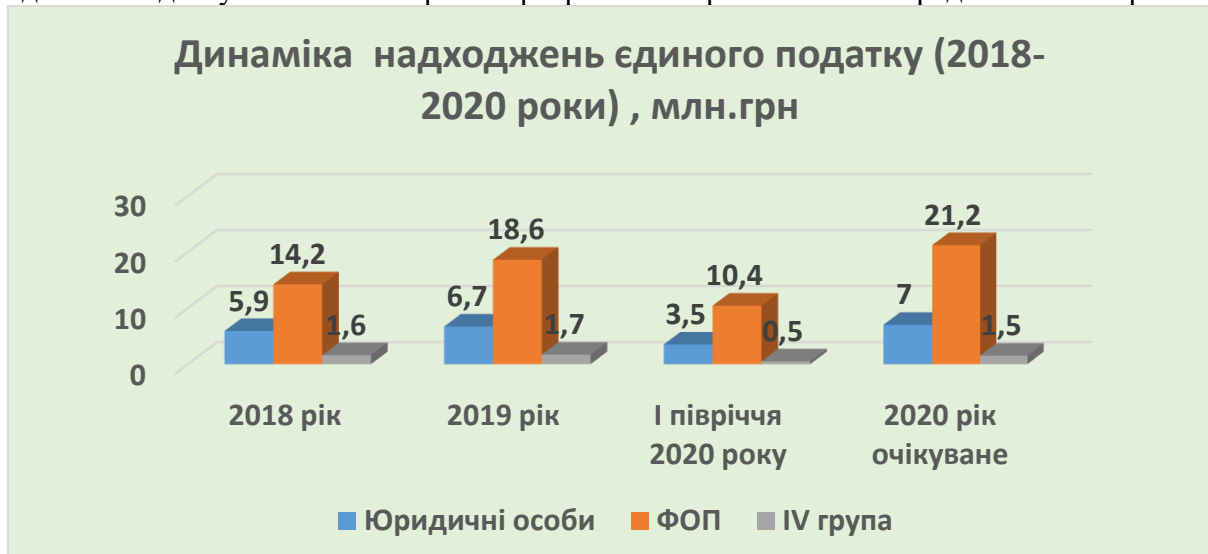
Рис. 2. Динаміка надходжень єдиного податку за 2018-2020 роки.

Так, спрощеною системою оподаткування скористалися 618 платників, у тому числі 100 юридичних осіб (III група), 480 фізичних осіб-підприємців (I-III групи) та 38 сільськогосподарських товаровиробників (IV група). Частка надходжень єдиного податку в структурі податкових надходжень зростає з 7,1% у 2018 році до 8,1 у 2020 році (очікуване). Зростання надходжень цього податку зумовлене збільшенням прожиткового мінімуму (для розрахунку єдиного податку платників I групи), мінімальної заробітної плати (для розрахунку єдиного податку платників II групи) та кількості платників, які обрали спрощену систему оподаткування та сплачують єдиний податок до місцевого бюджету. Динаміка надходжень єдиного податку за 2018-2020 роки в розрізі категорій платників представлена на рис. 2.